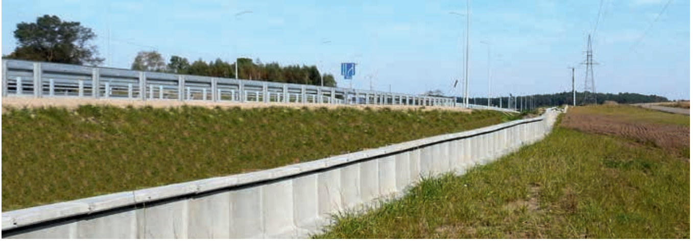
Przykład realizacji systemu optemFROG na DK20, obwodnica Kościerzyny