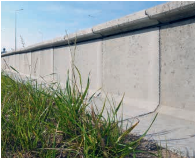
Zastosowanie systemu optemFROG na prostym odcinku

czeniu. Takie problemy nie występują natomiast w systemie optemFROG. System ogrodzeń betonowych można stosować na skarpach, przejmując obciążenie od parcia gruntu, co jest niemożliwe w przypadku innych systemów, które zostałyby wygięte lub uszkodzone.