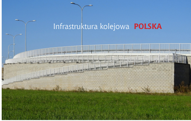
Zastosowanie murów oporowych z elementów drobnowymiarowych znajduje zastosowanie również w przypadku pochylni

kiej szerokości, co wiąże się z ograniczeniem zajmowanej powierzchni. Dzieje się tak dzięki zastosowaniu narożników wykonywanych pod kątem prostym. Przy konstruowaniu naroża muru wykorzystywane są bloczki wyposażone w dwie sąsiadujące ze sobą powierzchnie o fakturze kamienia łupanego. Zwieńczenie murów pochylni wykonane zostało z kap prefabrykowanych daszkowych. Takie rozwiązanie pozwala na mocowanie w bloczkach balustrad, jednak w przypadku konieczności zastosowania barier drogowych, latarni czy innych cięższych elementów wyposażenia technicznego drogi mur oporowy powinien być zwieńczony gzymsem monolitycznym. W przypadku murów oporowych na dojazdach do obiektów jako zwieńczenie murów zastosowano właśnie takie rozwiązanie.