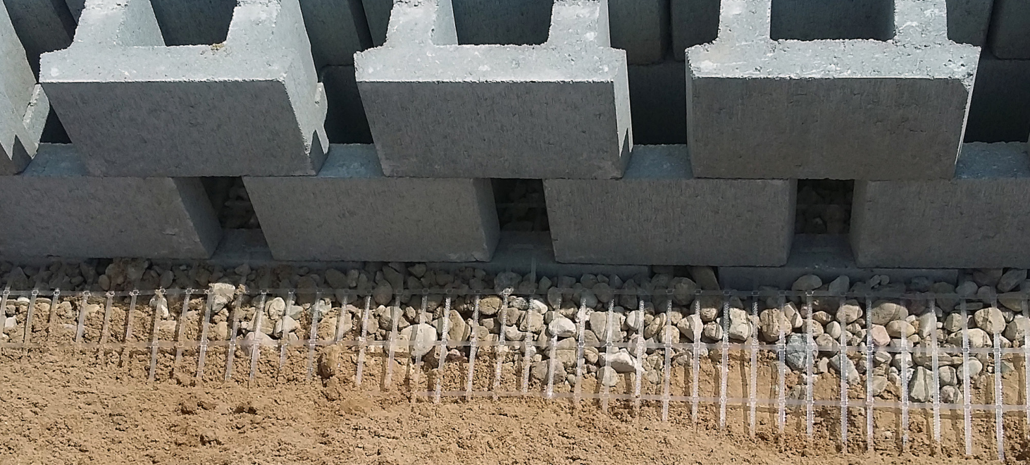
Mur oporowy w trakcie realizacji - widok od strony zasyпки muru

W systemie murów oporowych z gruntu zbrojonego optemBLOK geosyntetyki pełnią funkcję zbrojenia, przenoszącego naprężenia rozciągające od obciążenia ciężarem własnym i użytkowym. Grunt zbrojony stanowi zasyпка, którą przekłada się warstwowo geosyntetykami. Przez współpracę z gruntem zasypowym geosyntetyki zapewniają stateczność wewnętrzną konstrukcji, zapobiegając obsuwaniu się gruntu. Geosyntetyki są mocowane do drobnowymiarowych bloczków prefabrykowanych, pełniących funkcję oblicowania. Oprócz oblicowania ważną funkcją bloczków jest zabezpieczenie obiektu przed powierzchniową erozją, ochrona przed wpływem warunków atmosferycznych oraz nadanie konstrukcji estetycznego wyglądu. Łączniki z tworzywa sztucznego umieszcza się w specjalnych otworach w bloczkach oblicówki, umożliwiając ich pozycjonowanie, a przez to precyzyjne ustawienie kolejnych warstw bloczków. Dzięki temu można uniknąć zjawiska falowania muru, jest on prosty i estetyczny. Dodatkową funkcją łączników jest również zamocowanie geosyntetyków w bloczkach.