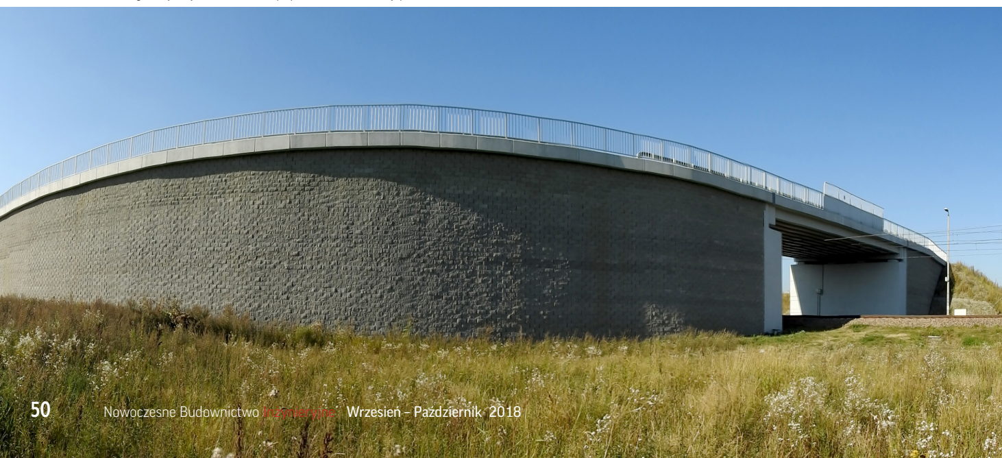
Długie dojazdy do wiaduktów poprowadzone zostały po łuku

W sąsiedztwie obiektu w km 122,431 zlokalizowana jest stacja kolejowa Wyszyny. Dla ruchu pieszego wykonano schody prowadzące na wiadukt (po obu stronach obiektu), natomiast w celu wyeliminowania barier architektonicznych dla osób z ograniczoną możliwością poruszania się powstały pochylne jako konstrukcje z gruntu zbrojonego. Mury oporowe optemBLOK umożliwiają konstruowanie pochylni o niewiel-