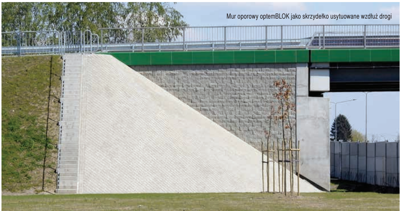
Mur oporowy optemBLOK jako skrzydełko usytuowane wzdłuż drogi

Jednym z najważniejszych i najbardziej powszechnych zastosowań murów oporowych są tzw. skrzydełka, które w przypadku budowy odcinka S8 Opacz – Paszków były konstruowane w formie murów usytuowanych wzdłuż drogi, równoległe do osi drogi oraz w formie skrzydełek ukośnych. Takie zastosowanie murów oporowych umożliwia znaczne ograniczenie powierzchni i długości skrzydełek oraz pośrednio wpływa na zmniejszenie ilości obrukowania stożków. System optemBLOK pozwala nie tylko na ograniczenie kosztów wykonania takiej konstrukcji, ale w znaczący sposób wpływa również na czas wykonywania danej ściany. W miejscach występowania płyty przejściowej należy miejscowo dogęścić rozstaw geosyntetyków, a dodatkowym usztywnieniem takiego muru jest zabetonowanie kanału wewnątrz bloczków do spodu płyty przejściowej. Takie wypełnienie betonem tworzy sztywny wieniec, który jeszcze bardziej poprawia stateczność muru w newralgicznym miejscu. Jest to szczególnie ważne w murach wzdłuż drogi,