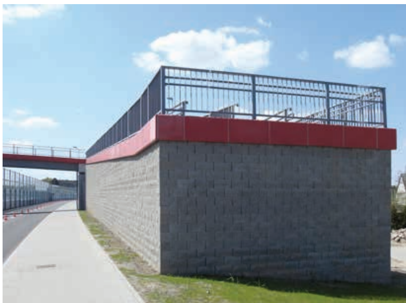
Mury oporowe z elementów drobnowymiarowych znajdują zastosowanie również w przypadku kładek

Z uwagi na postępujący proces urbanizacji istnieje coraz większy problem z wygospodarowaniem odpowiednio dużego miejsca pod inwestycję. W wielu przypadkach budowa muru oporowego zwalnia inwestora z konieczności wykupywania dodatkowego terenu lub wręcz pozwala na jego lepsze zagospodarowanie dzięki zaoszczędzonej przestrzeni. Przywołując wymienione wyżej, najważniejsze zalety systemu optemBLOK, można by pokusić się o stwierdzenie, że obecnie jest to jedno z najkorzystniejszych rozwiązań konstruowania murów opo-