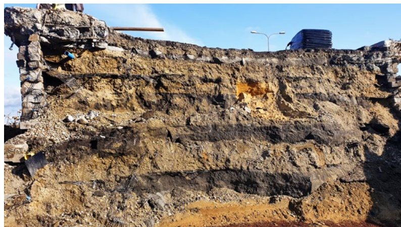
Ryc. 2. Przekrój rozbiieranej konstrukcji – widoczne warstwy materiałów zasypowych