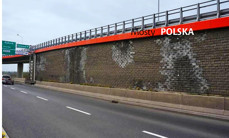
Ryc. 1. Stan konstrukcji przed rozbiórką – widoczne wykwity, zacieki i deformacje murów oporowych

W celu przywrócenia parametrów użytkowych i zapewnienia bezpiecznych warunków użytkowania obiektu nowo powstałe mury oporowe wykonano w systemie czynnym, w którym georuszty zbrojące grunt są kotwione w licu z prefabrykowanymi bloczkami drobnowymiarowymi. Stwierdzono, że nie ma potrzeby stosowania systemu biernego, a trwałość zapewni