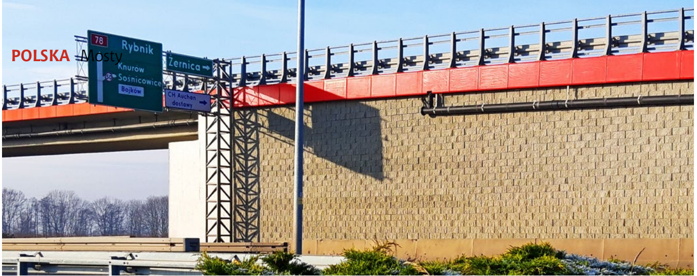
Ryc. 4. Gotowa konstrukcja obiektu

W miejscu połączenia dwóch systemów wykonano dylatację. Konstrukcję oporową zwieńczono monolitycznym gzymsem żelbetowym. Odtworzono warstwy nawierzchni wraz z wyposażeniem. Budowę murów oporowych zakończono na początku grudnia 2019 r.